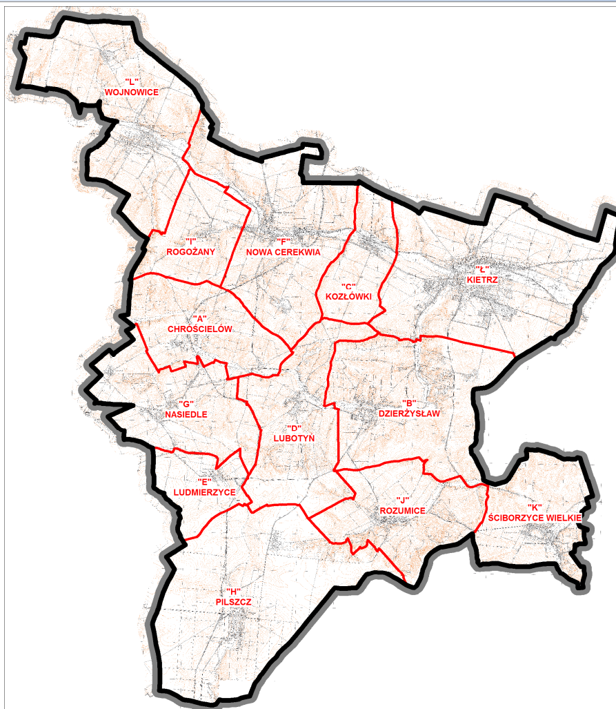
Rys. Podział gminy Kietrz na jednostki.