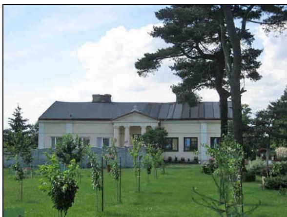
Fot. 13. Dwór w Łęgu Kasztelańskim