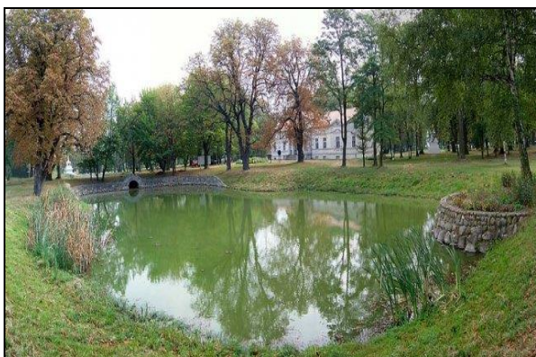
Fot. 8. Dwór wraz z parkiem krajobrazowym w Kucharach