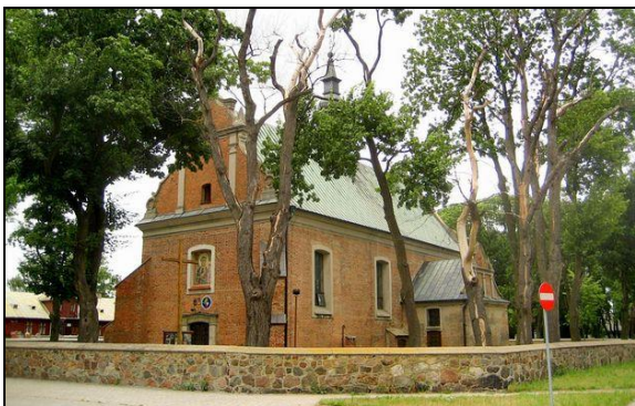
Fot. 6. Kościół parafialny w Drobinie