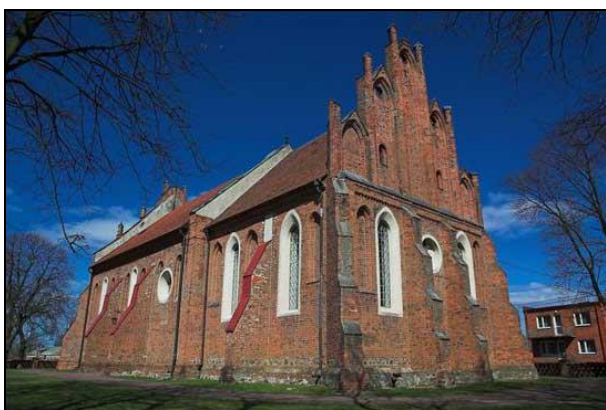
Fot. 10. Kościół pw. św. Katarzyny w Łęgu Probstwie