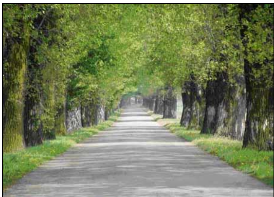
Fot. 1. Aleja topolowa wzdłuż drogi powiatowej Drobin – Koziębudy