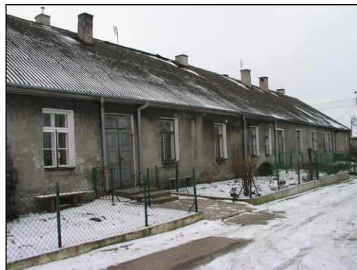
Fot. 7. Dawny zajazd murowany w Drobinie