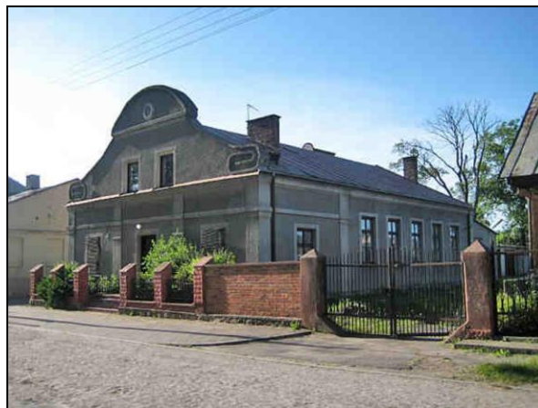
Fot. 15. „Nowa” plebania w Drobinie, Rynek 39