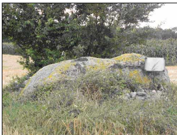
Fot. 5. Głaz narzutowy we wsi Warszewka