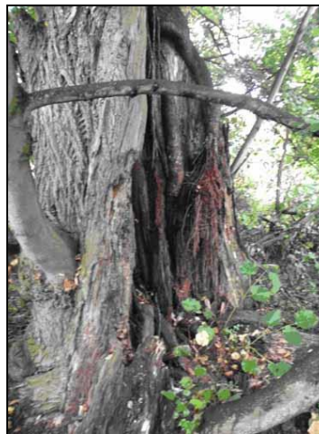
Fot. 3. Lipa w parku w miejscowości Karsy