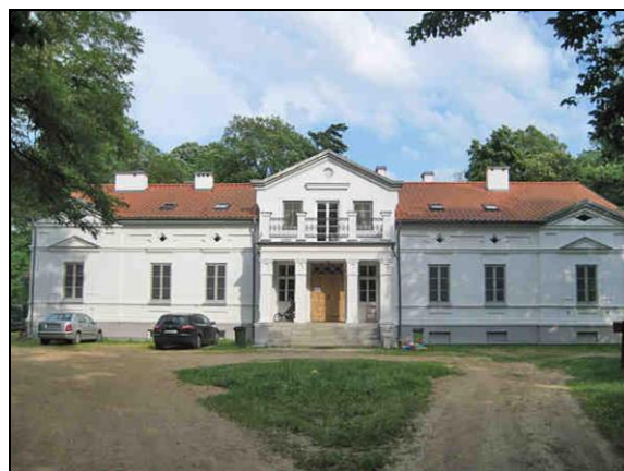
Fot. 9. Dwór w Kucharach