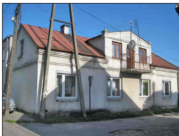
Fot. 16. Budynek mieszkalny z XIX-XX w., Drobin ul. Zaleska 33.