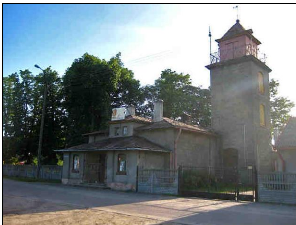
Fot. 14. Budynek straży pożarnej w Drobinie, pl. św. Floriana