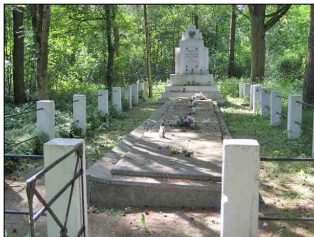
Fot. 17. Zbiorowa mogiła poległych w czasie II wojny światowej w Kozłowie