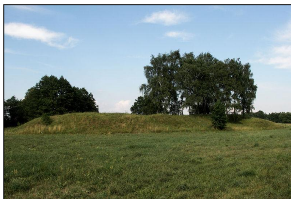
Fot. 11. Grodzisko w Mokrzk