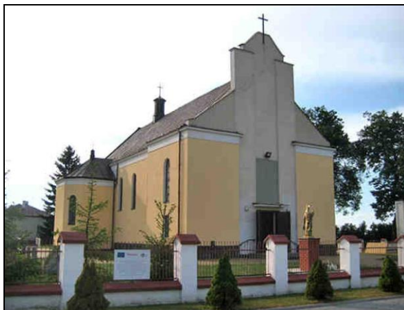
Fot. 12. Kościół pw. św. Wawrzyńca w Rogotwórsku