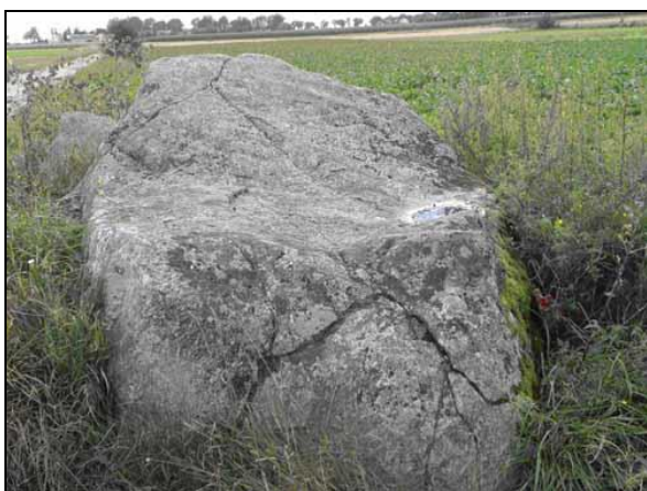
Fot. 4. Głaz narzutowy w Kozłowie