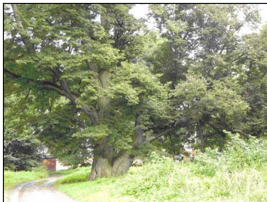
Fot. 2. Lipa na drodze wjazdowej do parku w miejscowości Karsy